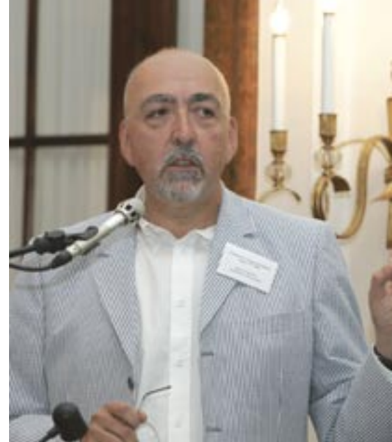
Der Stellvertretende Generaldirektor der Europäischen Kommission (Unternehmen und Industrie), Mag. Heinz Zourek

The percentage of projects with cost overrun in the public sector amounts to 73 %, whereas the percentage in the PPP sector merely amounts to 22 %. The same can be said about the problem of delayed completions: 25 % in case of PPP financed projects as opposed to 70 %. Roth referred to unreliable planning due to the political situation and to the low income in these countries, where charging high tolls according to the distance is not permitted, as problems for PPP financing. Long detours are frequently endured to avoid paying tolls.