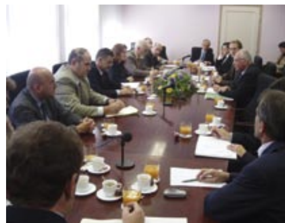
Vor- und Nachteile eines EU-Beitritts von Kroatien diskutierten Mitglieder der Regionalregierung, Bürgermeister und Vertreter der Wirtschaft von Virovitica.

Pros and cons of Croatia's accession to the EU were discussed by the members of the regional government for Virovitica as well as the mayor and economic representatives.