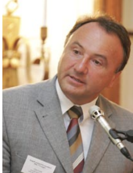
Der Vizepremier der Slowakischen Republik, Pál Csáky

Currently, Slovakia is making great efforts to “regionalise” the financial administration, a respective development plan for 2007 to 2013 is in the making. Csáky referred to financing and development of infrastructure as one of the most urgent matters in Slovakia. In the course of opening up new financial resources the possibilities to use PPP-models are under test.