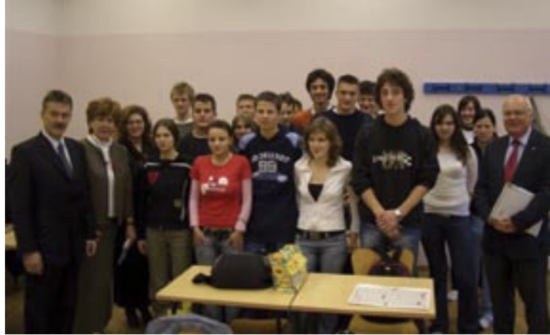
Angeregt diskutierten die Schüler des Gymnasiums Virovitica mit Schausberger über die Zukunft der EU. Pupils of the Highschool of Virovitica had a lively discussion with Schausberger about the future of EU.