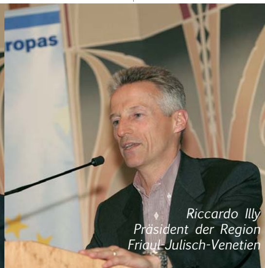
Riccardo Illy Präsident der Region Friaul-Julisch-Venetien