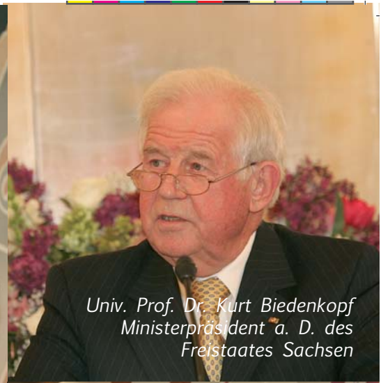
Univ. Prof. Dr. Kurt Biedenkopf Ministerpräsident a. D. des Freistaates Sachsen