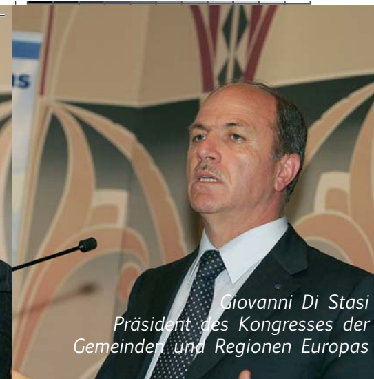
Giovanni Di Stasi Präsident des Kongresses der Gemeinden und Regionen Europas