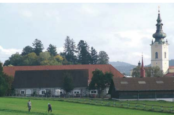
Meierhof des Stiftes Schlägl, Schauplatz der Ausstellung „Vom Grund aller Dinge“.