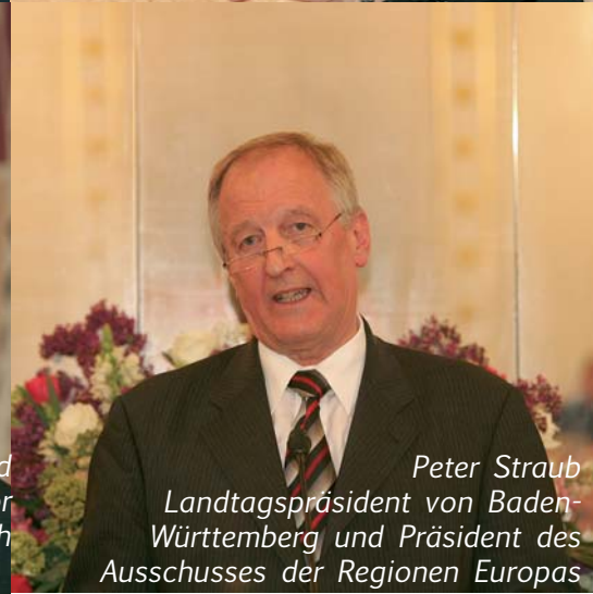
Peter Straub Landtagspräsident von Baden- Württemberg und Präsident des Ausschusses der Regionen Europas